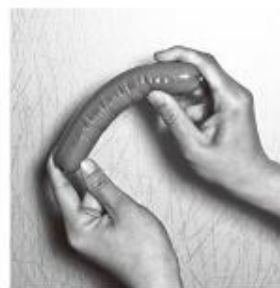
図2. 膜組織が柔らかい時の筋肉のふるまい